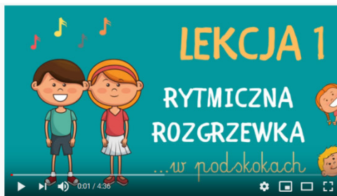
Lekcja 1 - Rytmiczna rozgrzewka W PODSKOKACH

Wszyscy wykonujemy ćwiczenia z rozgrzewki.