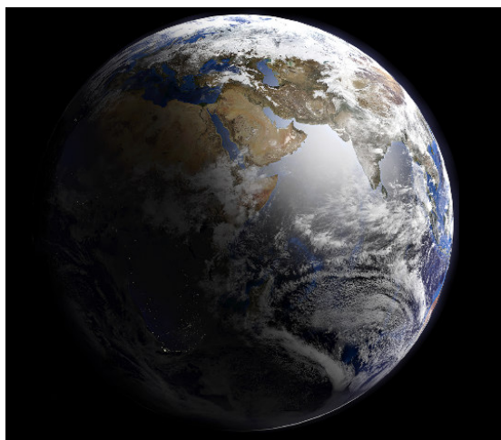
W tej samej chwili na kuli ziemskiej występują wszystkie pory dnia i nocy.