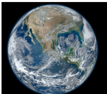
Widok Ziemi z kosmosu za dnia.