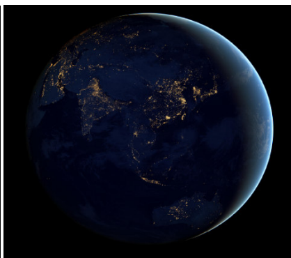
Widok Ziemi z kosmosu w nocy.