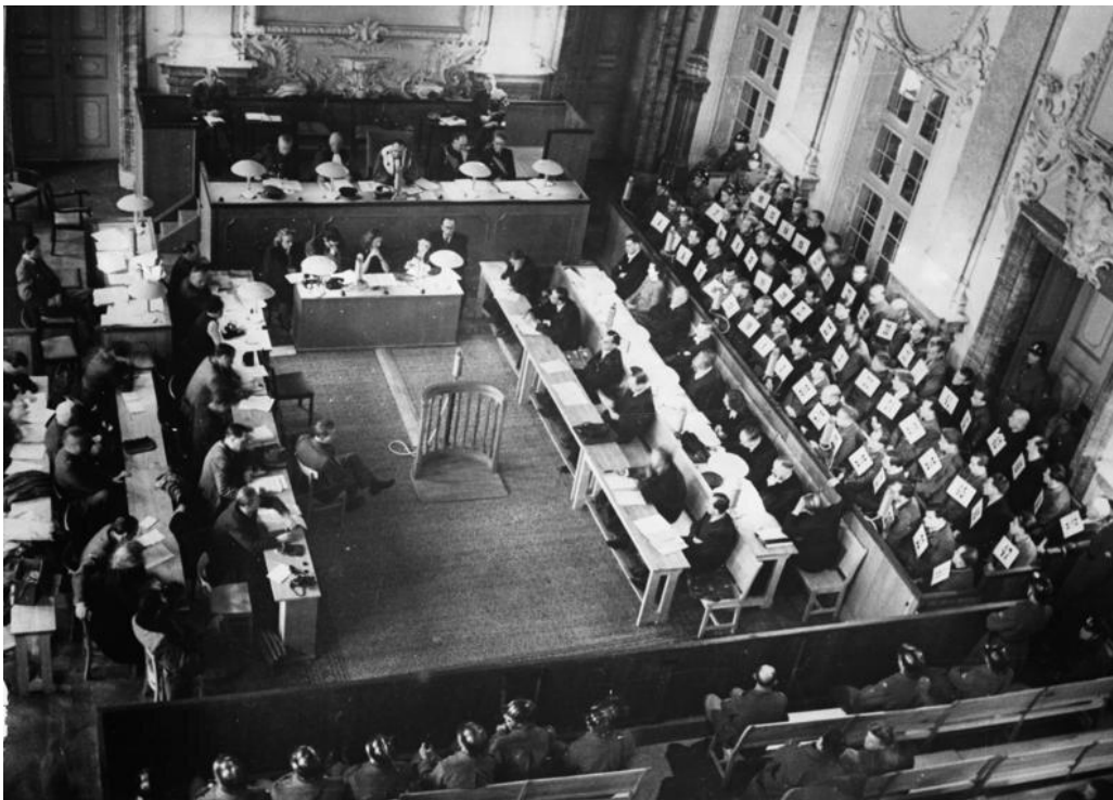
Bundesarchiv, Bild 183-V02830 Foto: o. Ang. | Dezember 1946