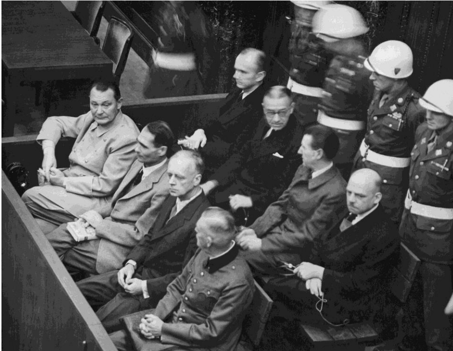
Proces w Norymberdze