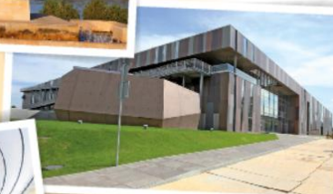
Centrum Nauki Kopernik