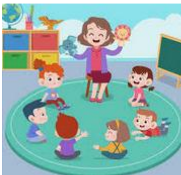
dzieci siedzące w kręgu

2. Poproś dorosłego o przeczytanie testu