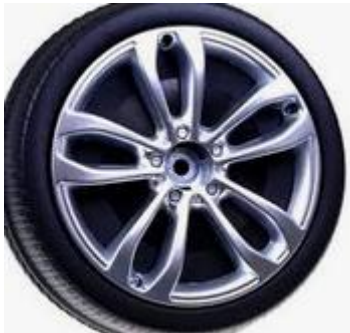
koło od pojazdu