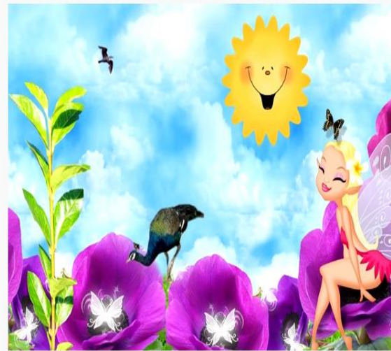
Maszeruje wiosna - Piosenki dla dzieci