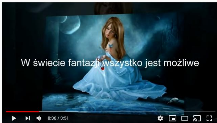
Fantazja - Faselki

Wiele razy każde z Was podczas zabawy uruchamia swoją fantazję. Dziewczynki nagle stają się księżniczkami, czarodziejkami czy super bohaterkami. Chłopcy nie raz są piratami, kierowcami rajdowymi czy najlepszymi piłkarzami na świecie.