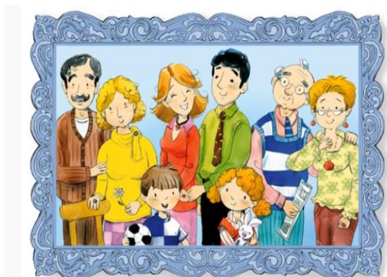
Piosenka - Moja wesola rodzinka

https://www.youtube.com/watch?v=9CAEhPUDIA4