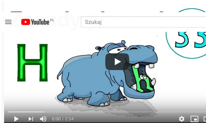
Ortografia obrazkowa - zasady pisowni h