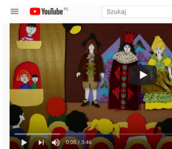
Jak powstaje spektakl teatralny?

https://www.youtube.com/watch?v=TkBHN9TYP-0 – Jak powstaje spektakl teatralny ? (animacja)