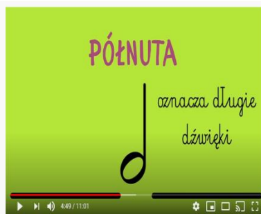
Lekcja 3 - Wartości rytmiczne W PODSKOKACH