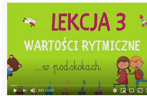
Lekcja 3 - Wartości rytmiczne W PODSKOKACH

Zaśpiewajcie poznaną tydzień temu piosenkę „Kto lubi śpiewać? My właśnie my....” Wykonajcie muzyczne polecenia lektorki!!