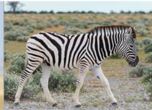
▲ Zebra damarska