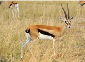
▲ Gazela Thomsona