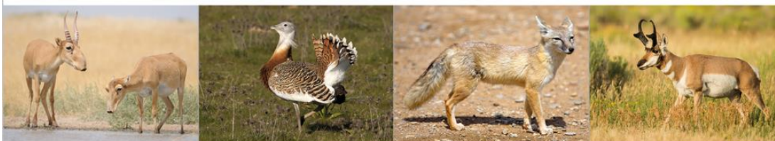
▲ Suhak stepowy