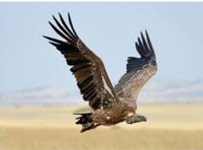
▲ Sęp afrykański