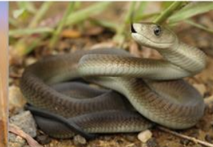
▲ Mamba czarna

Ludzie, którzy tu żyją wypasają stada zwierząt i przemieszczają się z nimi. Tych pasterzy nazywamy nomadami i taki styl życia jest np. w plemieniu Masajów.