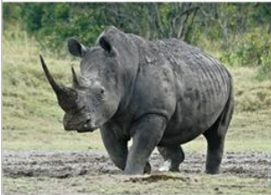
▲ Nosorożec biały