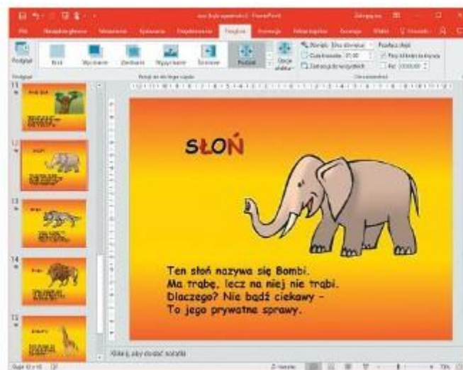
Rys. 4. Polecenia zmiany przejścia slajdu widoczne w górnej części okna na karcie Przejścia (Microsoft PowerPoint)

Wybrane ustawienia przejścia slajdu możemy zastosować do wszystkich slajdów prezentacji (przycisk Zastosuj do wszystkich ). Jeśli tego nie zrobimy, przejście zostanie zastosowane tylko do aktualnego slajdu.