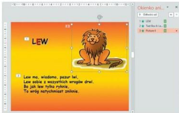
Rys. 2. Slajd z widocznymi numerami animacji i Okienko animacji. Wskazana jest animacja z numerem 3.

Dodawane efekty pojawiają się na liście w Okienku animacji (rys. 2.). Efekty na slajdzie pokazują się w kolejności zgodnej z pozycją na liście. Ich numery są widoczne na slajdzie przy elementach animowanych.