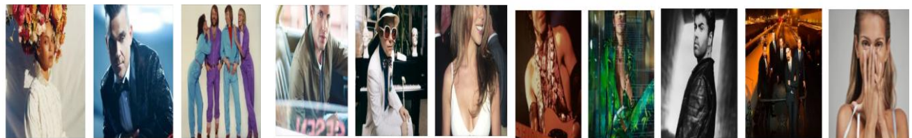
Beyoncé Robbie Williams ABBA James Blunt Elton John Mariah Carey Prince Jennifer Lopez George Michael Backstreet Boys Céline Dion

I jeszcze wielu, wielu innych! Wybierzcie sobie kilka nazwisk z tej długiej listy i posłuchajcie ich utworów!