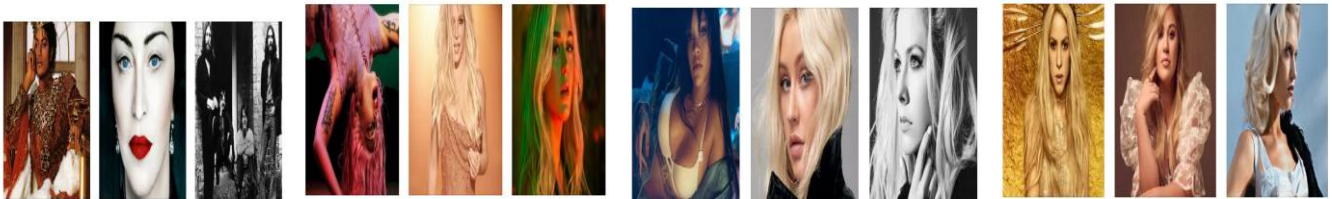
Michael Jackson Madonna The Beatles Lady Gaga Britney Spears Katy Perry Rihanna Christina Aguilera Avril Lavigne Shakira Kelly Clarkson Gwen Stefani