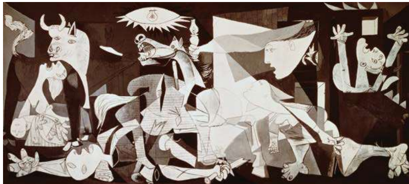
Pablo Picasso, Guernica , 1937 r.